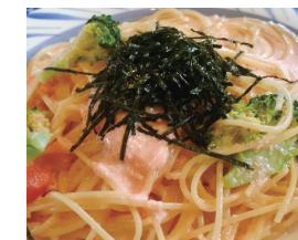
明太子クリームスパゲティ ¥1,200