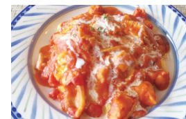
シーフードオムライス ¥1,200