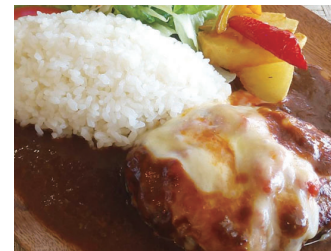
チーズハンバーグプレート ¥1,200