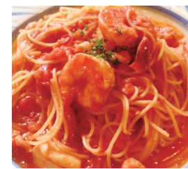
シーフードトマトスパゲティ ¥1,200