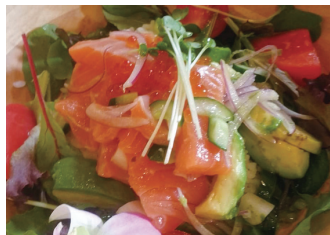
サーモンイクラポキボウル ¥1,200