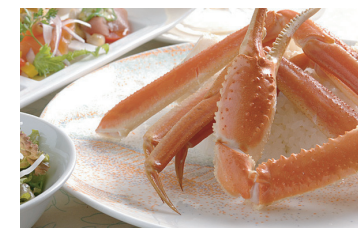
スペシャルカニピラフ ¥2,680

越谷で35年間以上変わらない当店の看板料理！かに風味バターライスとたっぷりのカニは相性抜群