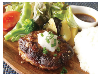
和風ハンバーグプレート ¥1,200