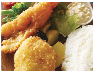
カニコロエビフライプレート ¥1,200