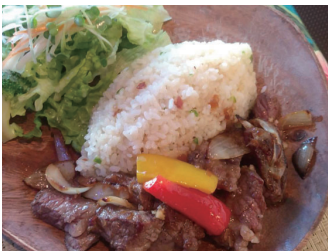
ビーフステーキプレート ¥1,400