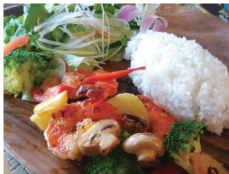
ガーリックシュリンププレート ¥1,200