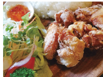
モチコチキンプレート ¥1,200