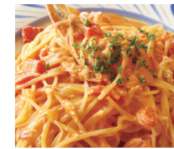
ズワイガニ トマトクリームスパゲティ ¥1,350