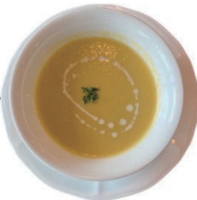
季節野菜のスープ