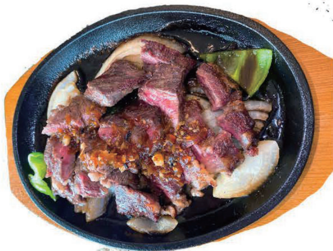
U.Sビーフステーキ 150g ¥1,800 300g ¥3,300