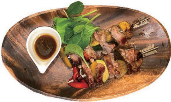
ハワイアンポーク串焼き ¥1,080