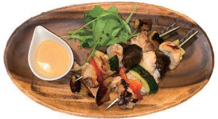
ハワイアンチキン串焼き ¥1,080